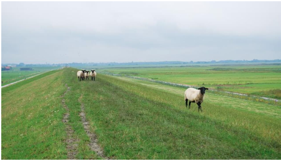
Ostfriesland Tourismus GmbH