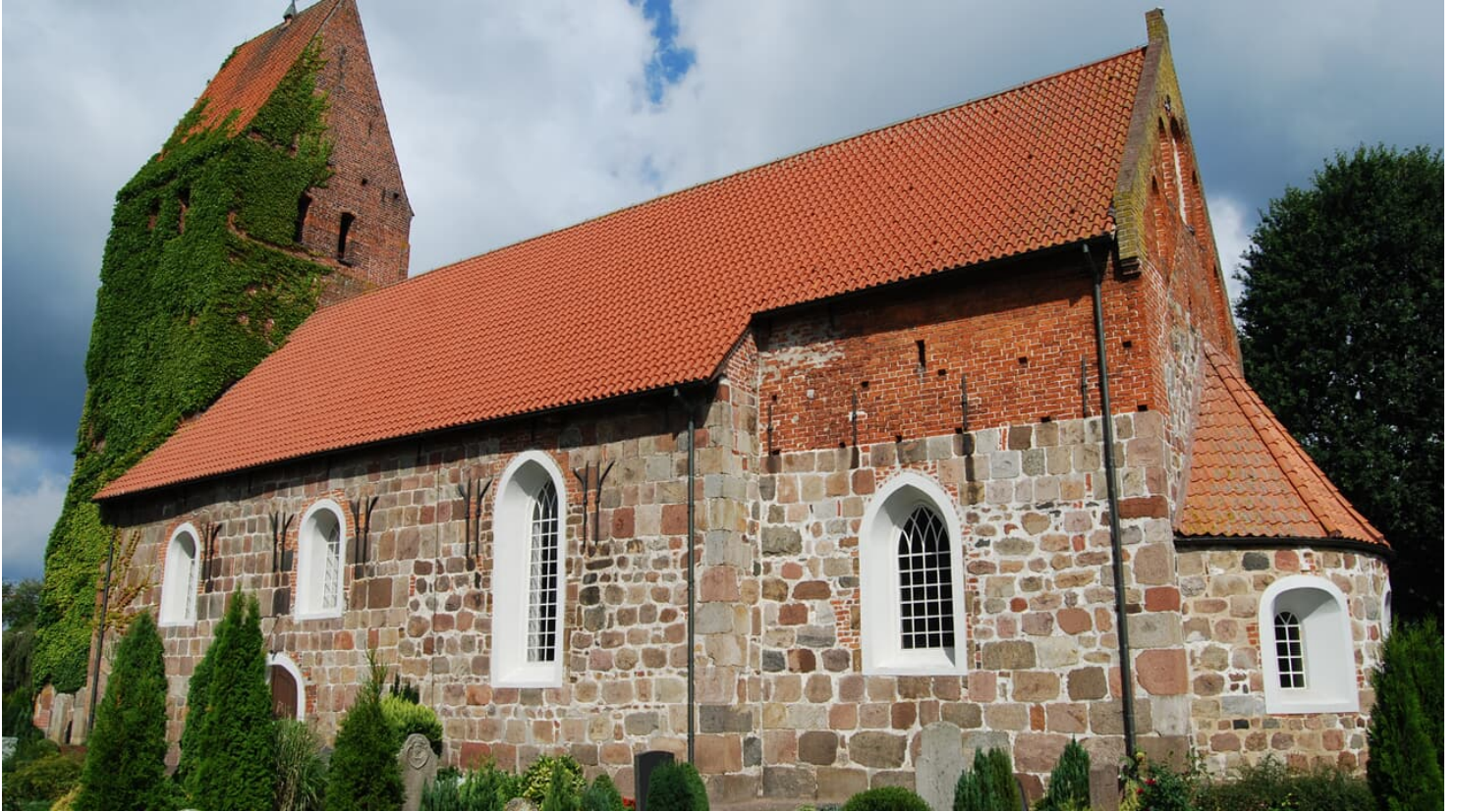
Kirche in Wiefelstede