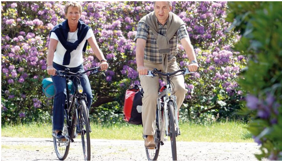
Ostfriesland Tourismus GmbH - Tobias Trapp