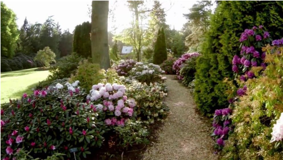
Aus Lust am Garten - Parklandschaft Ammerland