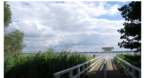
Bad Zwischenahn - Zwischenahner Meer