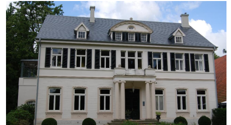
Gut Horn in Gristede