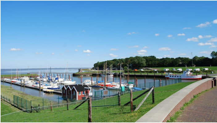
Dangaster Hafen - © Ostfriesland Tourismus GmbH - Frank Bullerdiek