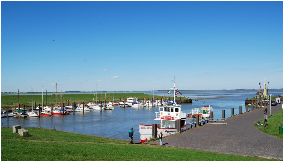
Dangaster Hafen - © Ostfriesland Tourismus GmbH - Frank Bullerdiel