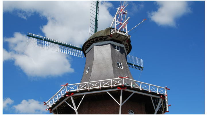
Vareler Mühle