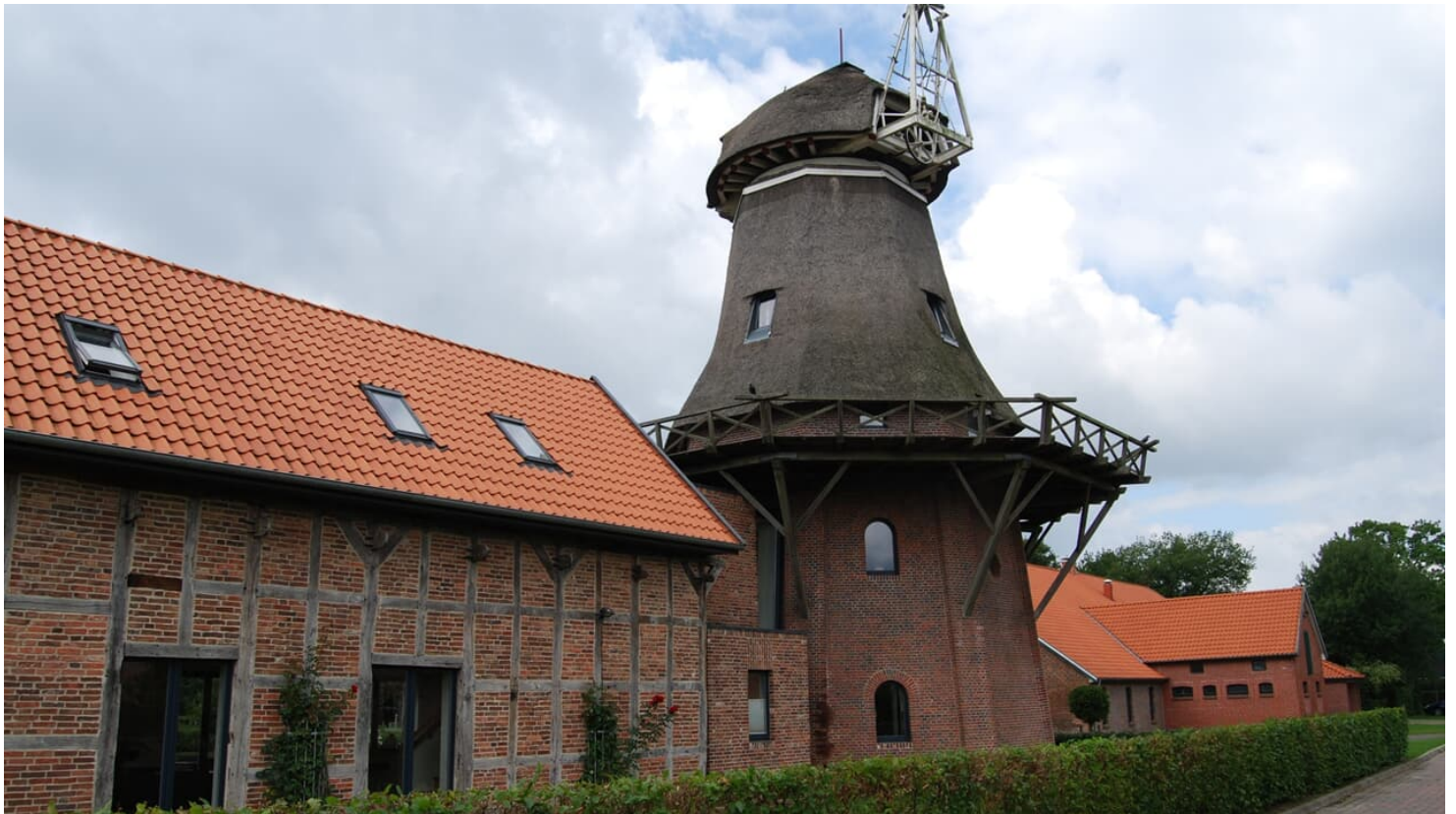
Wohnmühle in Torsholt