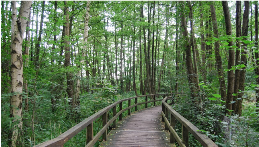
Steganlage Seerundweg am Zwischenahner Meer